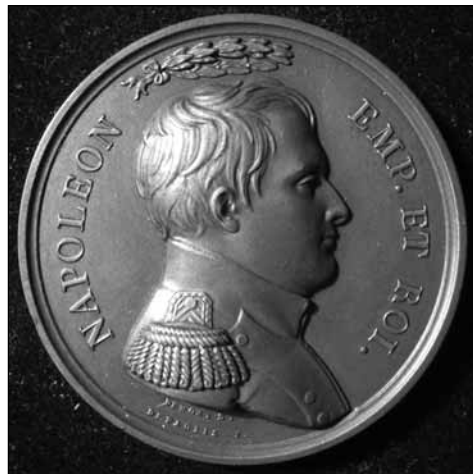
Медаль в память Парижского синедриона, созданного Наполеоном

по разворачиваться на глазах у всей Европы и с участием "русских бояр". После коронации новый самозванец становился Императором Востока и Запада и мог издавать указы уже как русский Царь. [...]