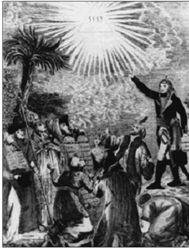
Наполеон несет свободу евреям

"...Наполеон стремился вступить в Москву победителем. [...] Заняв Москву, он планировал устроить грандиозные торжества собственного "венчания на царство" в Кремле. Опыт такого действия у него уже был. Для этого Наполеон предусмотрительно взял с собой актеров Итальянской оперы и балет. В походе его сопровождала труппа театра Французской комедии. В строжайшем секрете в июне 1812 года папу Пия VII привозят с юга Франции в Фонтенбло и держат там, вероятно, для последующей отправки в Москву. Участие папы как статиста могло пригодиться при коронации в Кремле. Согласие папы участвовать в спектакле можно было купить обещанием унии Восточной и Западной Церквей под державой Наполеона. [...] Венчание на царство в Кремле должно бы-