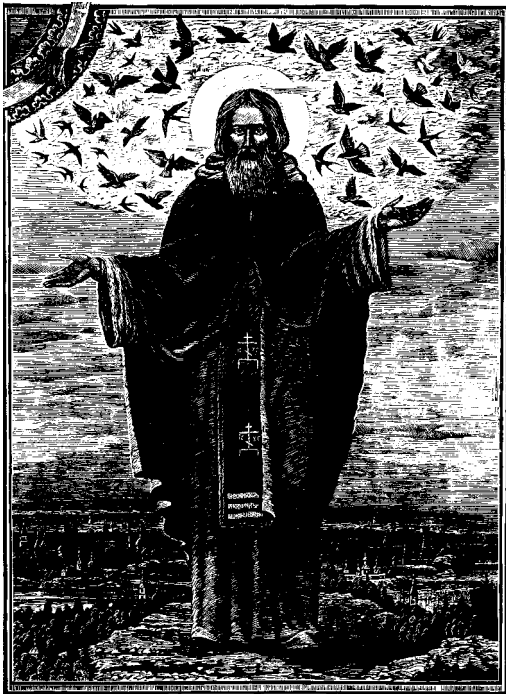
Преподобный Сергей Радонежский

ковых гравюр "Отечественная война 1812 года".