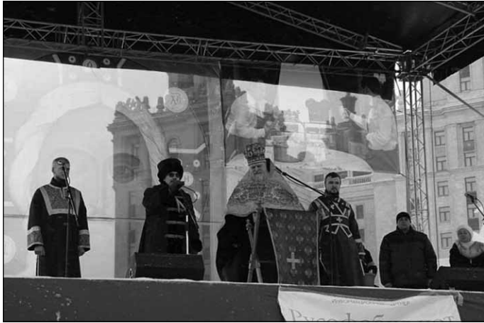
Выступает президент агрохолдинга "Русское Молоко"

Отец Алексей в свое время благословил поддержку и голосование на выборах за